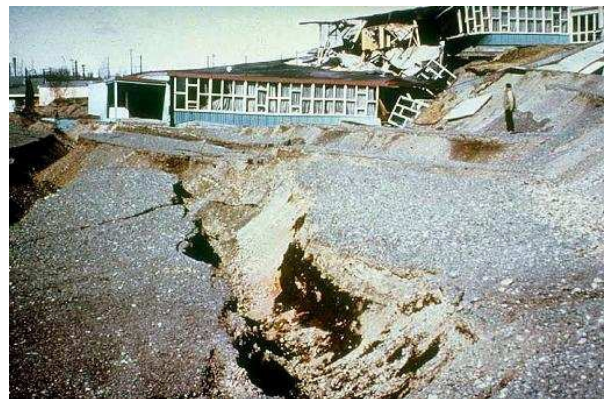
La escuela elemental de Government hill "desgarrada" por la subsidencia producida durante el sismo de 1964. Obsérvese la enorme grieta en primer plano, causada también por el sismo que alcanzó una magnitud 9,2.