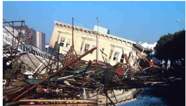
Edificios derrumbados e incendiados en Marina District, San Francisco. Loma Prieta, California, Sismo del 17 de Octubre de 1989.