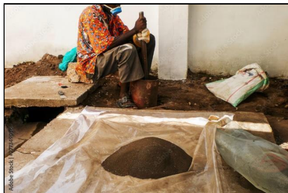
Fig. 2. Un miner artesanal de la RD del Congo triturant a mà mineral de coltan

La mineria es practica a totes les escales, des de les grans mines fins a molt petita escala: algunes d'aquestes tenen llicència, però moltes són il·legals. Les mines petites són explotades per la població local, els anomenats miners artesanals, en condicions perilloses i a canvi de molt pocs diners.