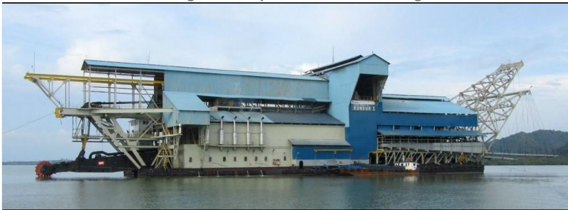
Fig. 3. Una draga d'estany a Indonèsia