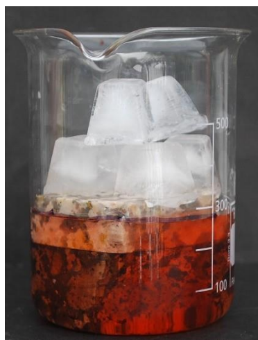
2. Cubitos añadidos y nivel de agua marcado.