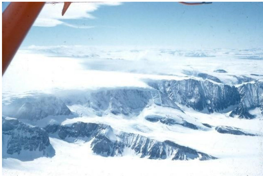
El casquete de hielo de la Península Antártica, con el primer plano de glaciares deslizándose hacia la plataforma de hielo de Larsen

Esta actividad investiga qué sucederá a nivel del mar cuando estos casquetes de hielo se derritan.