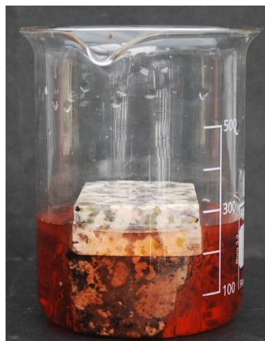
1. Agua teñida hasta unos 280 ml.

En la foto siguiente se han utilizado dos piezas de roca para representar un continente, pero en un laboratorio se podrían utilizar varios pesos de 100g.