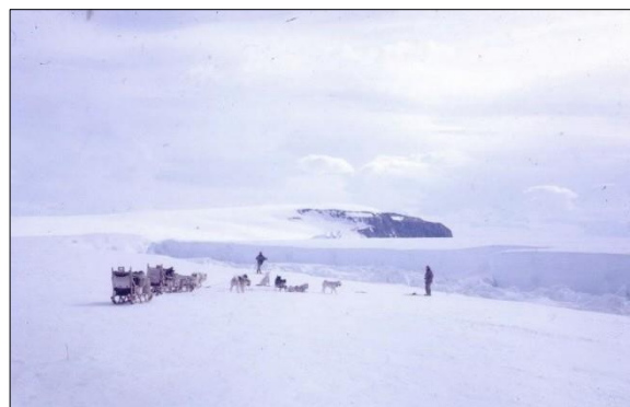
Un “rift valley” en la Plataforma de hielo Larsen B, cerca del Cabo Decepción el 1963. La plataforma de hielo flota sobre el mar y tiene un espesor de 300m en esta área.