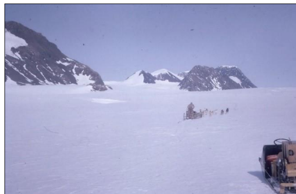
Viajando por el Glaciar Starbuck. El glaciar descansa sobre roca y el hielo tiene un espesor de 700m, en este punto.

2002, la parte B de esta plataforma, situada al norte del Cabo Decepción colapsó produciendo icebergs flotantes y mucho hielo roto. A medida que estos se fundan, no afectarán al nivel del mar. No obstante, la pérdida de la “protección” de las Larsen A y B ha producido un incremento de la velocidad de flujo de los glaciares provenientes de la Península Antártica y esto podría afectar al nivel del mar).