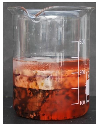
3. El nivel del agua sube hasta 450ml cuando se ha fundido todo el hielo.

Montaje de la actividad, utilizando trozos de roca para representar un continente