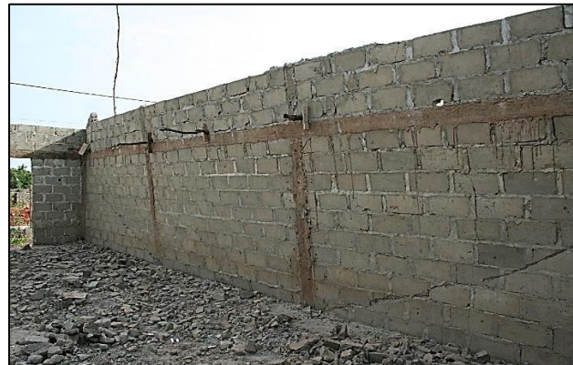
Pared dañada por el Monzón en Gambia.

Para la foto de la pista de deporte indoor, use la ley de las relaciones de intersección para averiguar qué cinta se pegó primero ¿la amarilla, la negra o la gris?