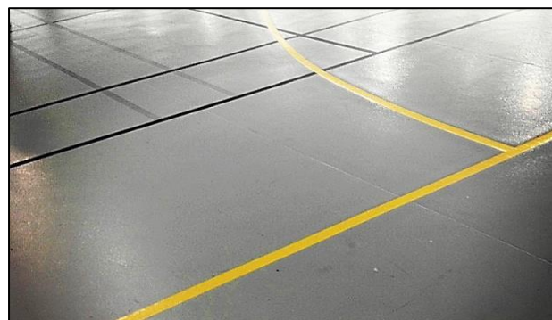
Pista de deporte marcada con cinta, Issy les Moulineaux, Francia.

Dcm250451 ha donado esta imagen al dominio público.