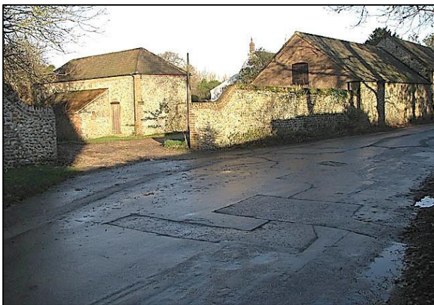
Camino reparado en una granja ¿cuál se depositó primero?

¿Cuál es la secuencia de alquitranado de la carretera reparada de debajo?