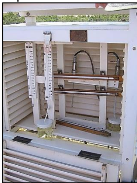
Termómetros de máxima y mínima en un dispositivo de Stevenson, Darwin, Australia.

D. Igual que con la temperatura, la precipitación se debería medir usando un pluviómetro y registrarla diariamente durante muchos años antes de poder apreciar cambios debidos al cambio climático.