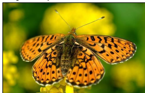
Doncella cobriza Boloria euphrosyne – los números de esta especie parecen ser sensibles al cambio climático.

D. Algunas especies de insectos, como las mariposas, las polillas y los escarabajos, parecen sensibles al cambio climático – hay más cuando hace más calor. Se puede registrar el número de mariposas, polillas o escarabajos clave si se encuentran en el patio de su casa o el de la escuela, haciendo observaciones regulares, con el fin de averiguar si hay cambios en decenas de años.