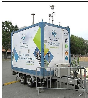
Estación de medida de la calidad del aire en Francia.

D. Alta tecnología. Se requieren instrumentos para medir la composición del aire. Pero incluso si los tuviese, la composición del aire local sería muy variable y no daría datos de la composición global del aire. Uno de los observatorios de referencia en la medida de la composición del aire se encuentra en la cima de una montaña en la isla pacífica de Hawaii – alto y lejos de continentes para poder medir el aire global “normal”.