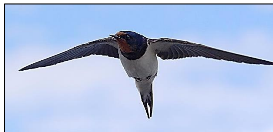
Una golondrina migrante, Alemania.

D. Las aves que migran, normalmente se van o llegan alrededor de la misma fecha cada año, como las golondrinas que llegan a Europa de su estancia invernal en África. Si se registra esta fecha y cambia a lo largo del tiempo, esto podría ser un indicador de cambio climático.