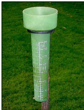
Un pluviómetro sencillo usado en Alemania.

Imagen del dispositivo de Stevenson de Bidgee bajo licencia Creative Commons Attribution-Share Alike 3.0 Australia. Imagen del pluviómetro de Kolling bajo los términos de la GNU Free Documentation License, Version 1.2