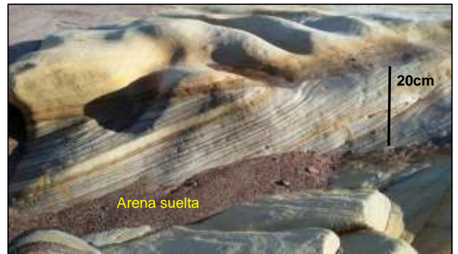
Bandas de areniscas y limolitas fluviales Rocas de la playa de Spittal, Northumberland.