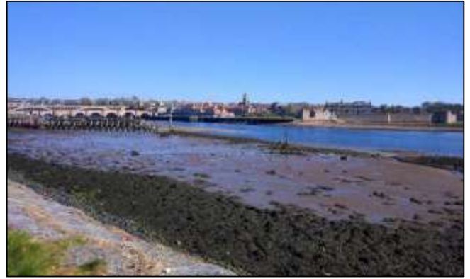
El río Tweed en estiaje, Berwick upon Tweed, Northumberland