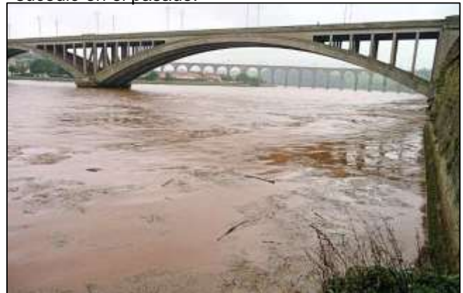
Avenida del río Tweed, Berwick upon Tweed (Ian Kille, Northumbrian Earth)

sedimentos. El sedimento finalmente será comprimido y cementado de manera natural por minerales que ya se encuentran en el sedimento y formará una roca sedimentaria. Los minerales de la arcilla (fango) se comprimirán hasta formar arcillita. Las rocas también registran la actividad del río. Esta es una de las formas en que los geólogos pueden averiguar qué sucedió en el pasado.