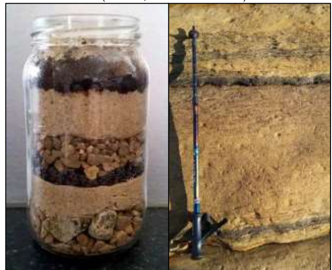
A la izquierda, jarra de unos alumnos. A la derecha, capas de sedimento que incluyen areniscas de grano grueso, medio y fino, limolita i arcillita (bandas oscuras). Sedimento depositado por ríos hace unos 300 millones de años. Rocas de la playa de Spittal, Northumberland.