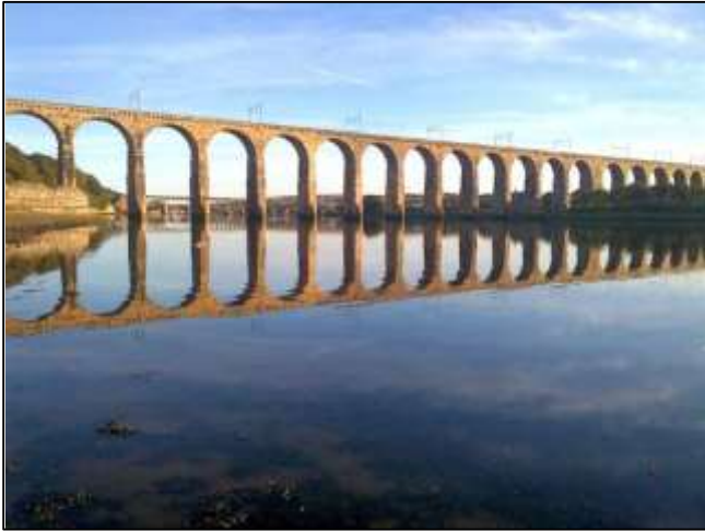
El río Tweed en condiciones normales, Berwick upon Tweed, Northumberland