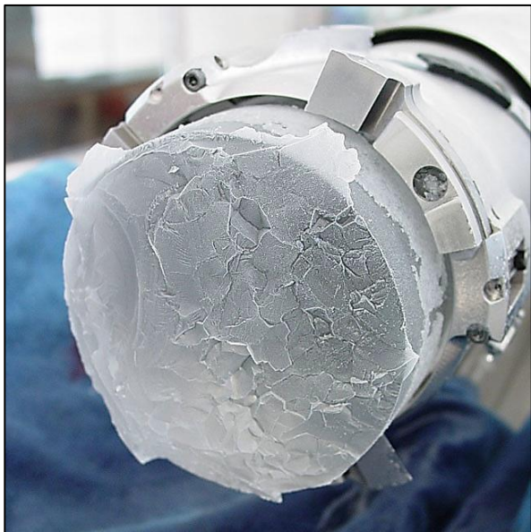
Un testigo de hielo.

Esta comprensión se puede utilizar para interpretar la gráfica de temperaturas e isótopos de oxígeno encontradas en un testigo de hielo.