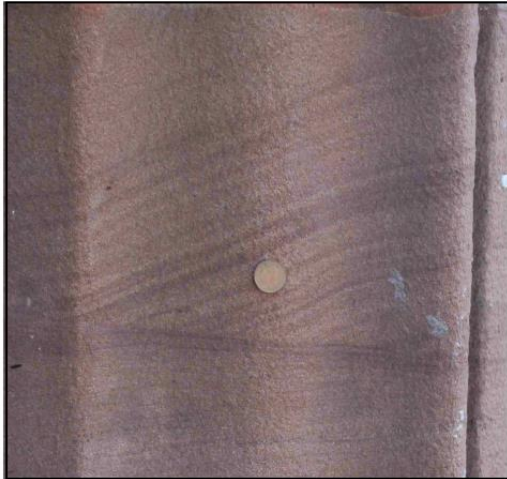
Foto 4: Arenisca roja de la fachada de un edificio (Moneda = 2cm)