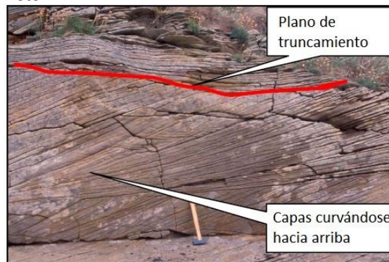
Foto 2: Estratificación cruzada en areniscas en Eday, Islas Orcadas. Las capas están en posición normal.

Podemos usar estas informaciones para averiguar si una arenisca con estratificación cruzada está en posición normal o ha sido invertida por los movimientos terrestres (o cuando se ha utilizado en una construcción). Explique este principio a la clase utilizando la Foto 2.