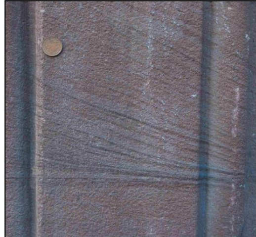
Foto 5: Arenisca roja de la fachada del mismo edificio (Moneda = 2cm)