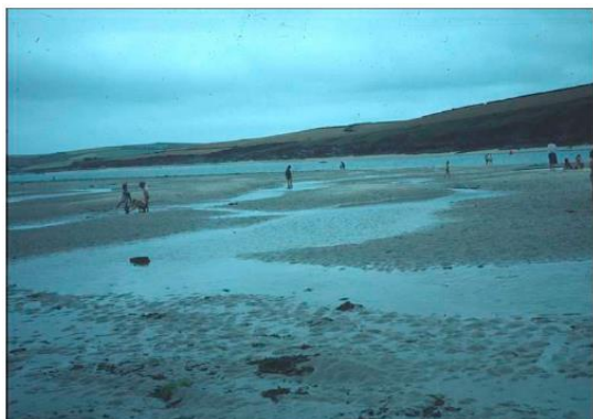
Foto 1: Dunas subacuáticas formadas en una playa; las dunas se han formado por corrientes de marea en dirección al mar durante la bajada de la marea.

Cuando el agua fluye sobre arenas sueltas, se pueden formar dunas a pequeña escala como las que se ven en la Foto 1.